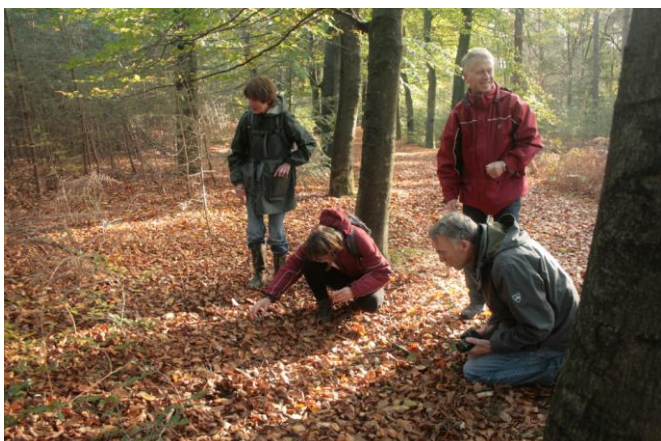
Deelnemers aan de excursie bestuderen een rodekoolzwam