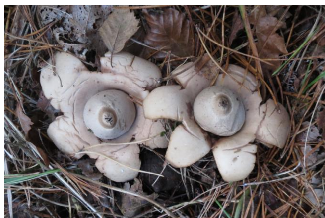
Gekraagde aardster Geastrum triplex

Meer foto's zijn op waarneming.nl te vinden: https://waarneming.nl/user/photos/6432?sure=1&groep=11