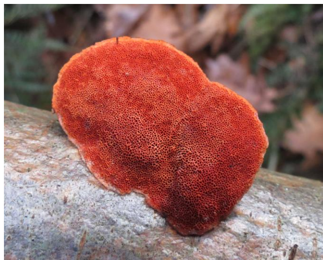
Vermiljoenhoutzwam Pycnoporus cinnabarinus

Tijdens de wandeling hebben we meer dan dertig soorten paddenstoelen gevonden, waaronder gewone zwavelkop, kastanjeboleet en parelamaniet; muizenstaartjes, die op dennenappels groeiden; nevelzwammen in grote cirkels; elfenbankjes op boomstronken; tonderzwam en berkenzwam, die op stammen groeiden; bovisten; amethistzwam, die in symbiose met de beuk leeft en naar zijn kleur ook rodekoolzwam genoemd wordt; zwarte dodemansvingers en opvallend rode vermiljoenhoutzwammen. We kwamen ook paddenstoelen tegen die niet op naam te brengen waren, meest kleine bruine paddenstoelen. Het determineren van paddenstoelen is niet altijd eenvoudig. Er zijn erg veel soorten, waaronder veel soorten die erg op elkaar lijken, zodat er in een aantal gevallen microscopisch of chemisch onderzoek nodig is om vast te stellen om welke soort het gaat.