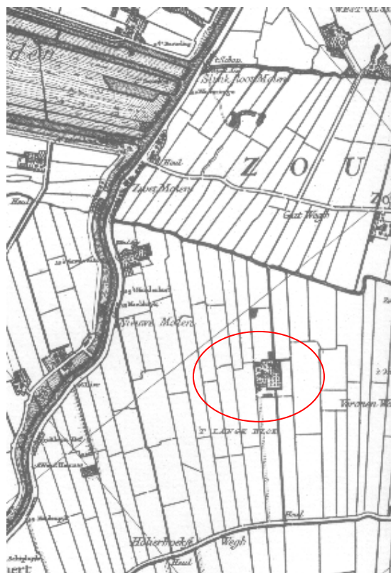
Figuur 1. De boerderijterp op de Kruikius-kaart van 1712