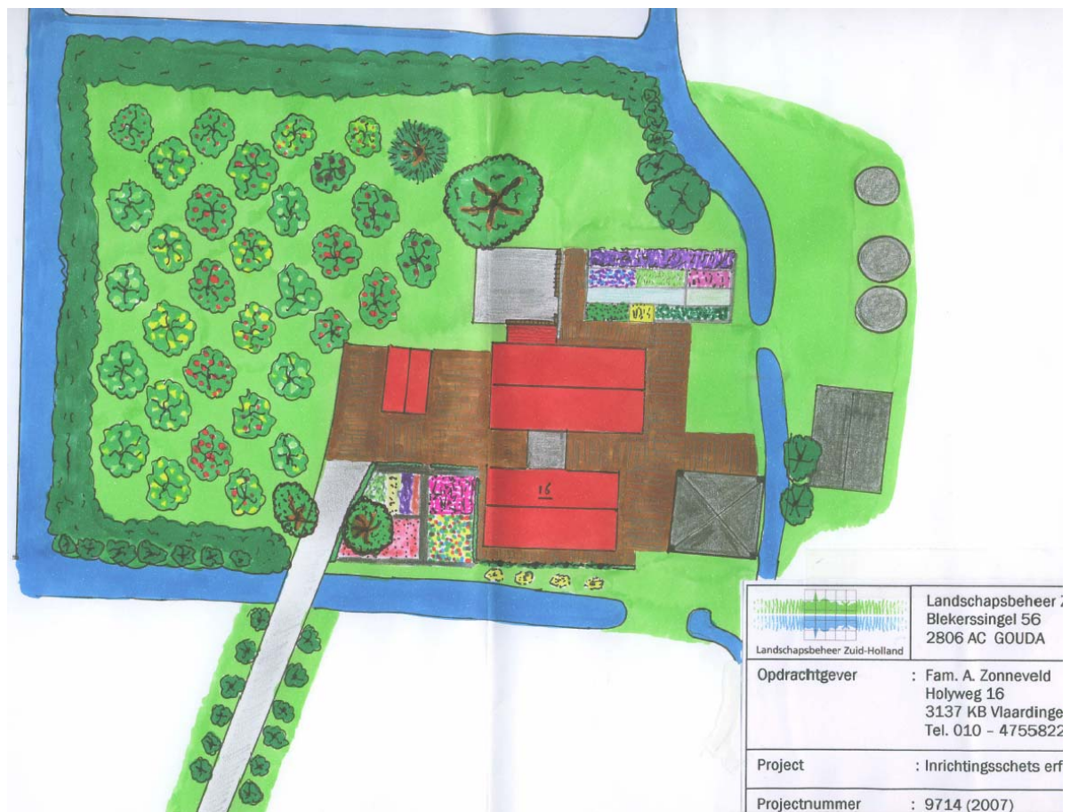
Figuur 2. Ontwerp Landschapsbeheer Zuid-Holland voor voor- en zijrf Holyweg 16

Blijkt verkoop om welke reden dan ook niet mogelijk, dan wordt voorgesteld dat door Vockestaert een bruikleenovereenkomst met de familie Zonneveld wordt overeengekomen. In beide constructies is de familie Zonneveld bereid om de aanleg volgens het ontwerp op eigen kosten uit te voeren.