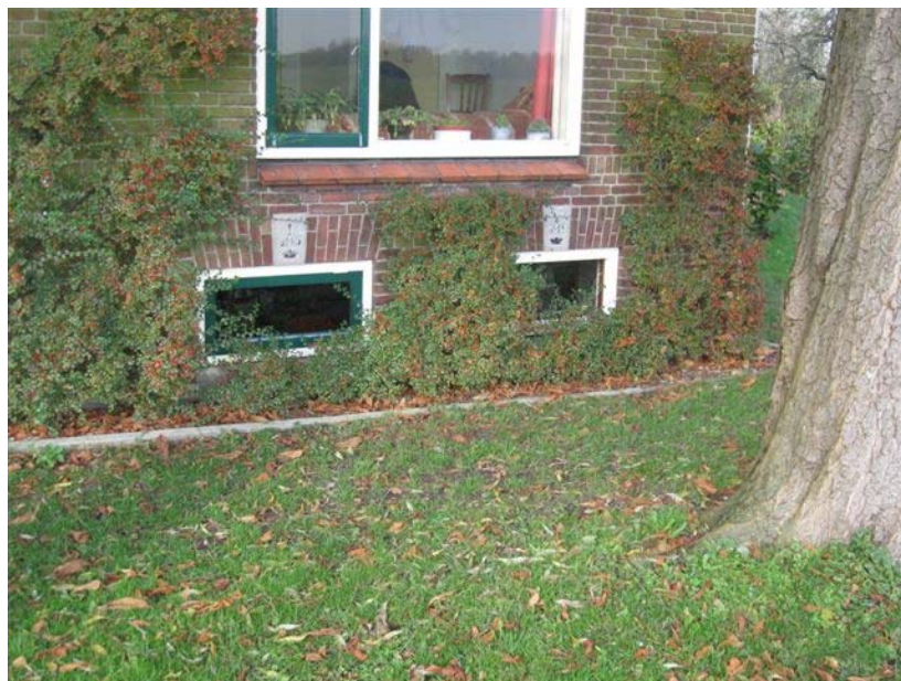
Melkkelderramen met het IHS-embleem in het voorhuis

Vockestaert, KNNV, Landschapsbeheer Zuid-Holland, Weidevogelvereniging, LTO Delflands Groen, Boshoeck, Midden-Delfland Vereniging, Midden-Delfland is Mensenwerk, Historische verenigingen, Hoogheemraadschap van Delfland, Groenservice Zuid-Holland, Gemeenten Midden-Delfland, Schiedam en Vlaardingingen.