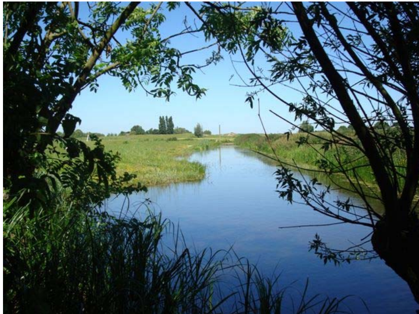
Oude waterloop van het boerderijterrein naar de Zweth (zie kaart Kruikius 1712 op p. 4)

Het ophangen op het erf van diverse nestgelegenheden voor vogelsoorten behorend bij een boerderijerf, zoals de huiszwaluw, de boerenzwaluw, de steenuil en vleermuissoorten (Gewone dwergvleermuis; waarnemer Ben van As, april 2011).